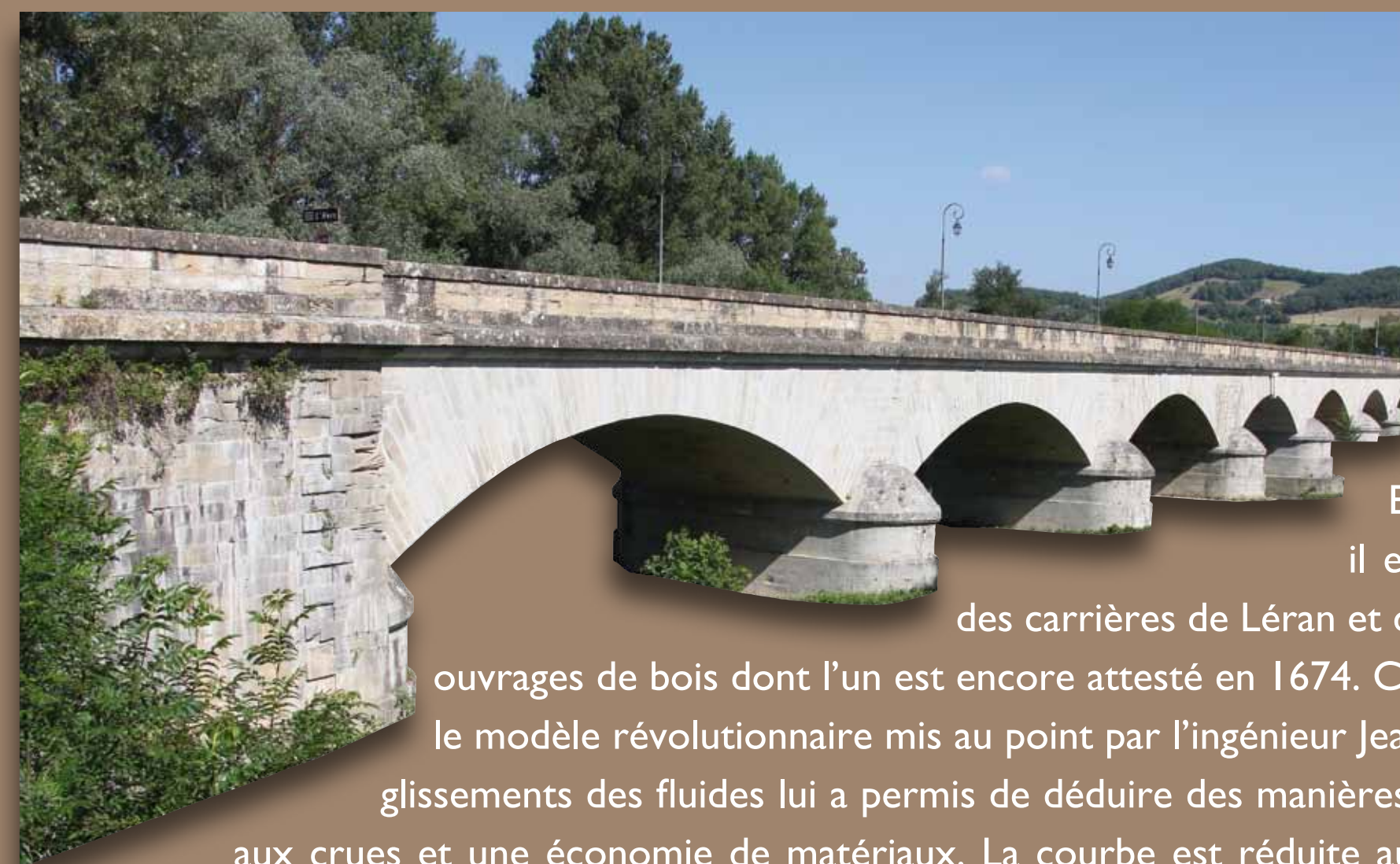
Pont de l'Hers

Cinq moulins fariniers sont connus pour Mirepoix au XVI e siècle. Toutefois l'eau sert à bien d'autres usages : scieries à bois, tanneries et fabriques de textile même si, malgré la volonté des seigneurs de Lévis, cette dernière activité ne connaît pas d'essor. Au XIX e siècle, la vannerie est comptabilisée dans les statistiques industrielles. Elle s'approvisionne aussi bien dans les oseraies locales créées vers 1870 autour de la ville, qu'en dehors du département. L'agriculture et l'artisanat restent omniprésents. Plus qu'un centre industriel, Mirepoix est la plaque tournante du commerce du fer issu des forges de la montagne et du bois de sapin. Le rapport de l'intendant Ballainvilliers en 1788 y note l'importance des marchands. A la fin de l'Ancien Régime, les municipalités de Toulouse, Carcassonne ou Pamiers sollicitent Mirepoix pour qu'elle demande son rattachement à leur département respectif. Ceci dénote sa richesse. La ville compte 4 061 habitants en 1836 et 3 277 en 2008.