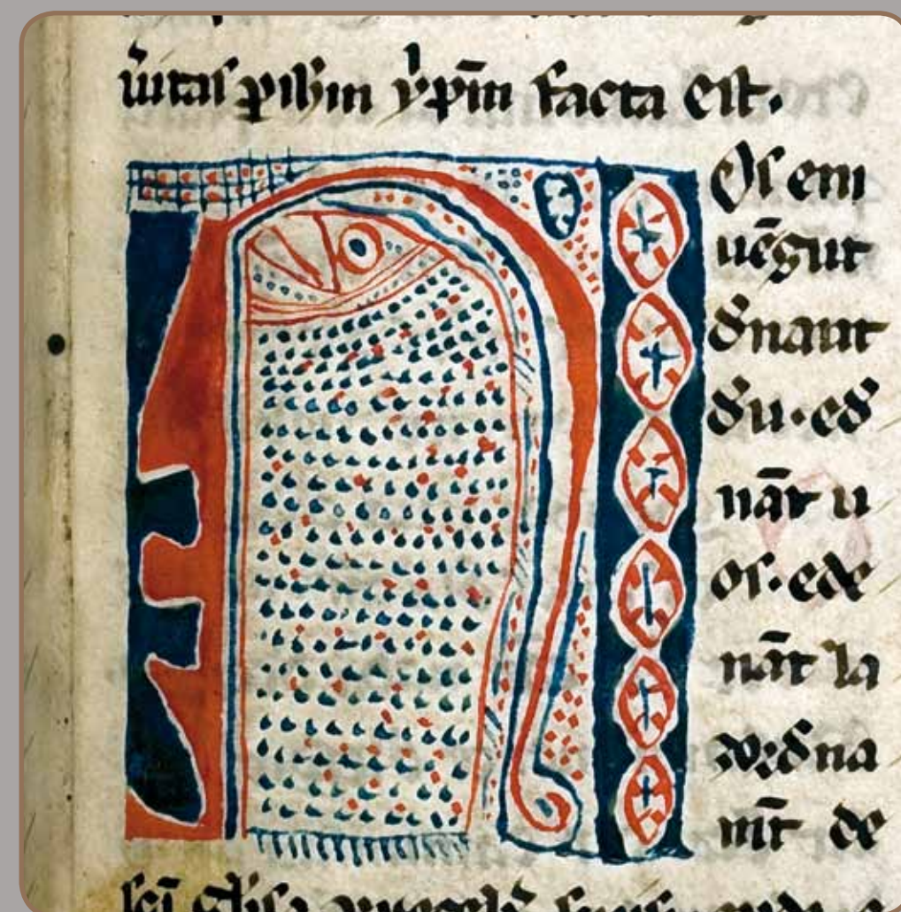
Début du rituel cathare, copié à la suite de la Bible cathare en occitan, Ms PA 36, folio 237v.

Hiérarchisée et organisée, c'est une véritable Eglise qui propage sa foi et dispense le consolament, le baptême par imposition des mains. Après la croisade contre les Albigeois commencée en 1209, la terre de Mirepoix est remise à Gui de Lévis, principal lieutenant de Simon de Montfort.