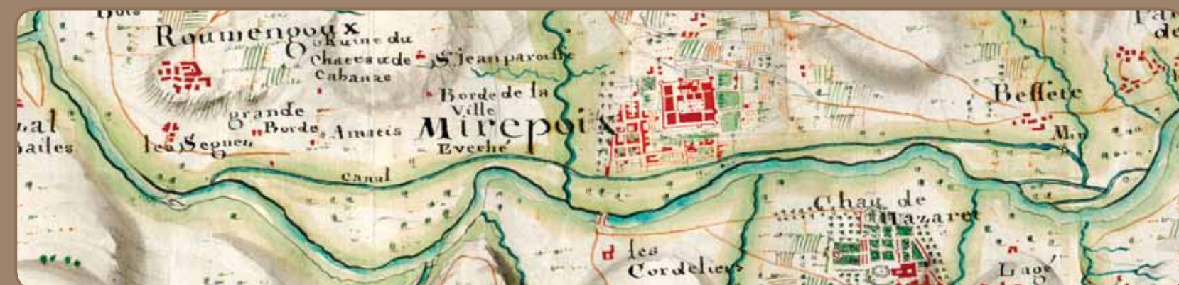
Carte des Basses Pyrénées vers 1720 (détail), orientée sud/nord pour les besoins militaires, © Ministère de la Défense J10C1343

Dès 1720, il dérive l'eau de l'Hers depuis " Gailhadé " jusqu'au moulin de la commune de Besset, fournissant au passage l'énergie nécessaire à ceux de Mirepoix. Il atteint une dizaine de kilomètres de long lorsque la prise d'eau est déplacée au lieu-dit actuel " Robinson ". Si l'on parle ici en 1825 d'une minoterie, c'est sans doute dû à l'importance du site : huit employés, une production de 360 tonnes de farine, pour environ 6 000 hectolitres de blé, vendue jusqu'à Perpignan, Montpellier, la Tour de Carol. L'activité reste toutefois très soumise à la conjoncture. Les vannes de décharge permettant de régler le débit de l'eau sont encore visibles.