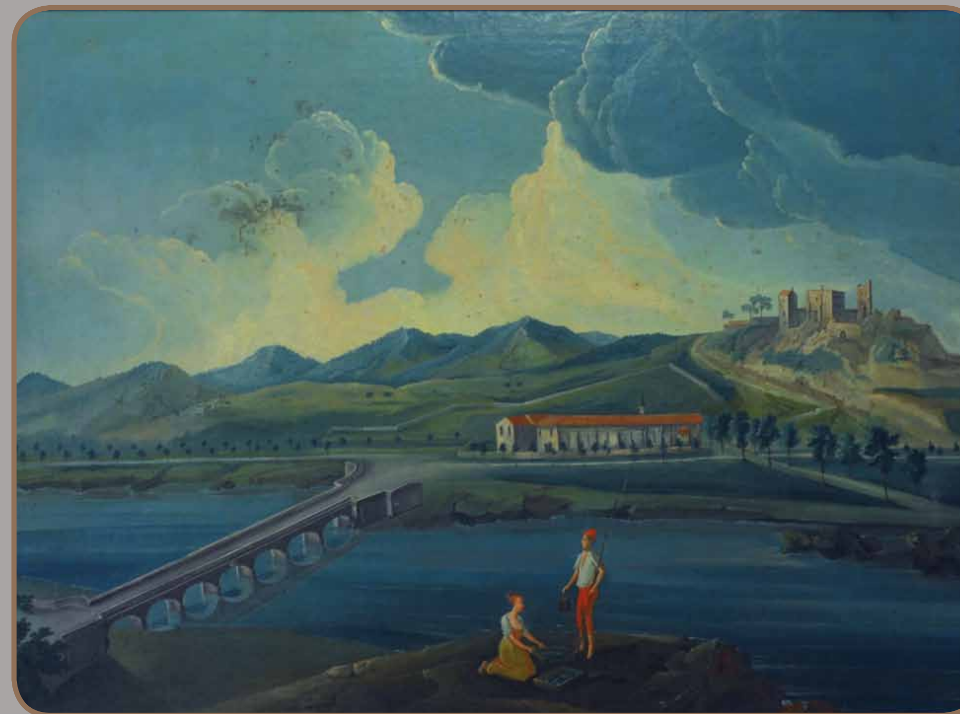
Vue du pont de Mirepoix et du château de Terride, peinture anonyme du XVIII e siècle, Inv. 2006-1-2-3