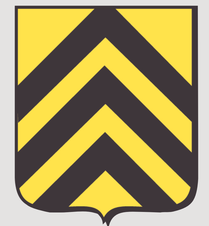
Blason de la famille de Lévis © Michel Sabatier/Grame

En la colina se encuentra el Mirepoix del año mil: un pueblo fortificado al pie de una casa señorial (castrum). Se compone de unas cincuenta casas comunitarias cátaras; aquella forma medieval de cristianismo que se presenta como una Contra-Iglesia. En 1206 un concilio reúne a 600 " buenos cristianos ". Después de la cruzada contra los albigenses, Gui de Lévis se adueña de él. Pero, en 1289, una crecida del Hers destruye el pueblo que es reconstruido en su lugar actual.